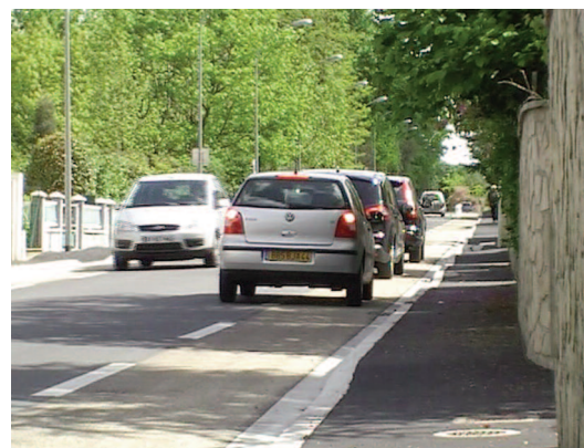
Exemple de chaussée à voie centrale banalisée en milieu urbain

En effet, les véhicules motorisés sont, par défaut, autorisés à circuler (pour se croiser), s'arrêter et stationner sur la rive.